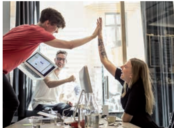
Theorie und Praxis verbinden – wie genial dual!

Als Serviceeinheit des zuständigen Wissenschaftsministeriums bündelt die Duale Hochschule Rheinland-Pfalz das gesamte duale Studienangebot durch eine zentrale Informationsplattform und agiert als Servicestelle für Studieninteressierte, Hochschulen und Unternehmen. Die dualen Studienangebote sind dabei Angebote der einzelnen Hochschulen des Landes. Auch durch die Etablierung dualer Masterstudiengänge und die Entwicklung internationaler dualer Studienangebote wird die Duale Hochschule ein wesentliches Element in der Zusammenarbeit zwischen